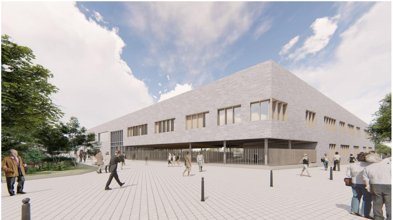
Vue de l'entrée - © Archi5 Prod / Facea / Claude Mathieu associés