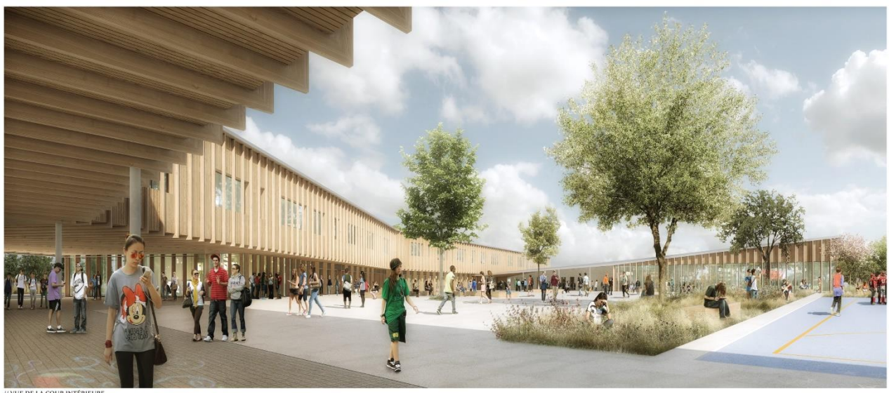
Vue de la cour intérieure - © Archi5 Prod / Facea / Claude Mathieu associés

Le collège sera construit sur une surface de 6 559 m 2 et pourra accueillir 664 élèves, dont 64 collégiens en SEGPA (sections d'enseignement général et professionnel adapté).