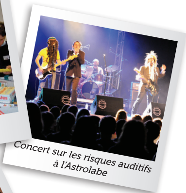
Concert sur les risques auditifs à l'Astrolabe