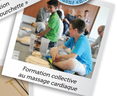
Formation collective au massage cardiaque