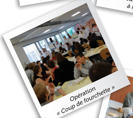
Opération « Coup de fourchette »