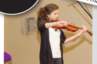
Concours St'Art : les collégiens ont du talent