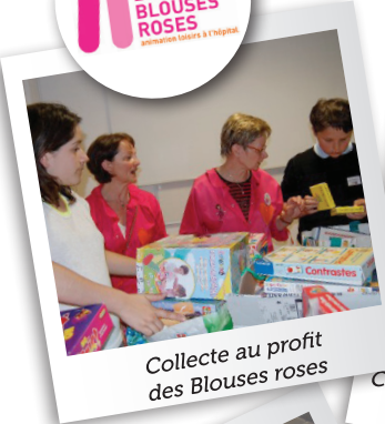
Collecte au profit des Blouses roses