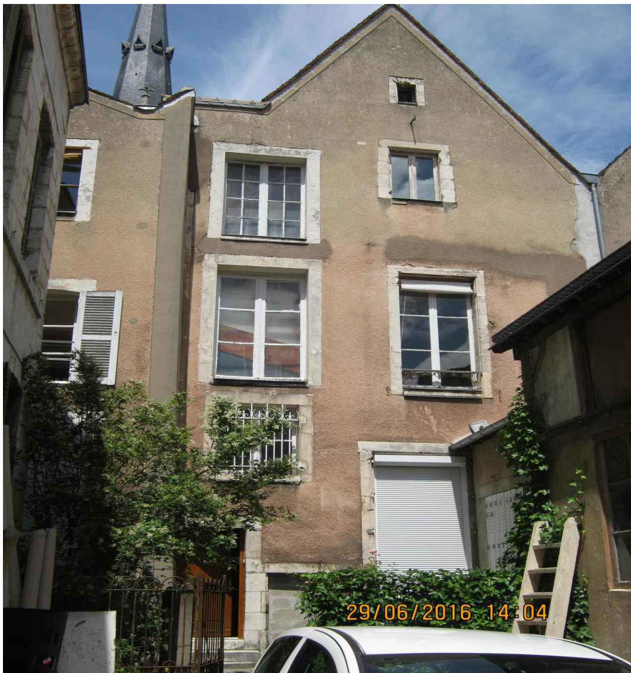
Façade côté cour