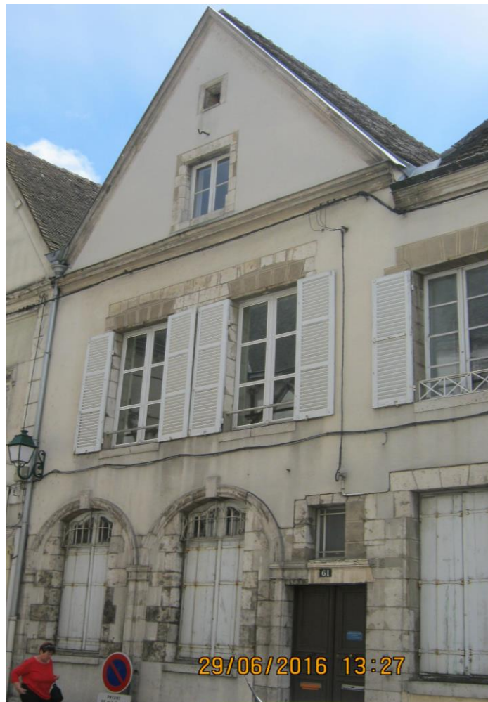
Façade côté rue