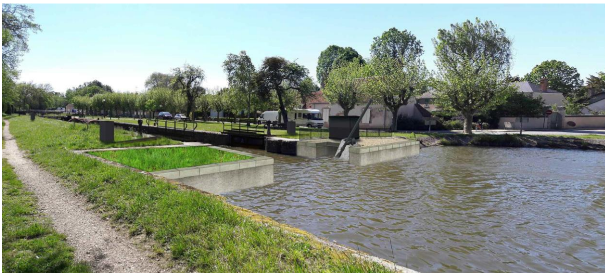
Photomontage des travaux achevés sur l'écluse de Vitry