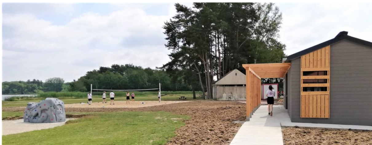
Vue sur les nouveaux aménagements à l'étang de la Vallée

Convaincu du potentiel touristique de cet étang de 70 hectares, le Département a réalisé en 2021 d'importants travaux de réhabilitation de la plage et de ses abords, pour un montant total de 750 000 euros (assainissement, destruction et reconstruction du bloc sanitaire, amélioration de la circulation sur le parking, mise en œuvre de jeux de plein air).